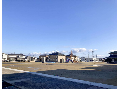
グランステージ西裏館